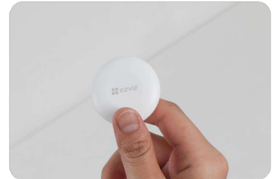
Armas/Desarmar el control de armas